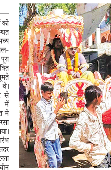
मंदिर में महादेव की महाआरती की गई तत्पश्चात श्रद्धालुओं को प्रसाद वितरण किया गया।

महाशिवरात्रि के अवसर पर नगर में प्रतिवर्ष की भांति इस वर्ष भी रविवार को कुंड मोहल्ला स्थित प्राचीन शिव मंदिर से भगवान शिव जी भव्य बारात निकाली गई। बारात में डीजे, ढोल-तागा और बम-बम लहरो के जयघोष से पूरा नगर गुंजायमान होता रहा। श्रद्धालु शिवभक्तों में सराबोर होकर महादेव के भजनों पर- झूमते हुए शोभायात्रा में नाचते गाते हुए चल रहे थे। स्थानीय कुंड मोहल्ला प्राचीन शिव मंदिर से भगवान देवादिदेव महादेव को बग्गी में विराजमान कर बारात निकाली जिसमे बारात में शामिल श्रद्धालुओं का जगह-जगह पुष्प बरसा कर व जलपान करा कर स्वागत किया गया। शिव बारात सुबह 11 बजे कुंड मोहल्ला से प्रारंभ होकर नगर के प्रमुख मार्ग कुंजड़ा मोहल्ला, सदर बाजार, कृष्णा चैराह, पंडा पुरा खड़िया मोहल्ला होते हुए बापिसा स्थानीय कुंड मोहल्ला प्राचीन शिव मंदिर पहुंची, जहां शिवजी की बारात का समापन किया गया। समापन के दौरान शिव