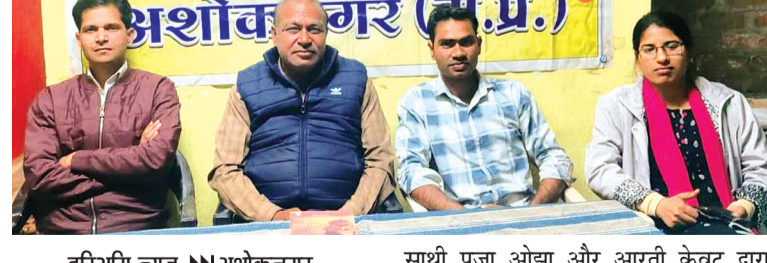
कल देर शाम जनवादी लेखक संघ के स्थापना दिवस के अवसर पर जनवादी लेखक संघ, जिला इकाई अशोकनगर द्वारा एक गोष्ठी का आयोजन कर रचना पाठ एवं वैचारिक संवाद कायम करते हुए समकालीन विद्वृताओं के बीच लेखक संगठनों की चुनौतियों विषय पर भी चर्चा की गई। इस अवसर पर जलेस की