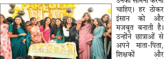
जूनियर छात्राओं ने सौनियर छात्राओं को दी भावमयी विदाई