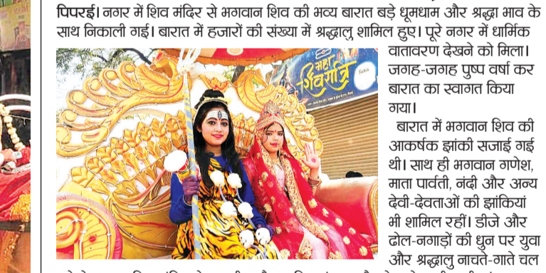
पिपरई। नगर में शिव मंदिर से भगवान शिव की भव्य बारात बड़े धूमधाम और श्रद्धा भाव के साथ निकाली गई। बारात में हजारों की संख्या में श्रद्धालु शामिल हुए। पूरे नगर में धार्मिक वातावरण देखने को मिला।

पिपरई। नगर में शिव मंदिर से भगवान शिव की भव्य बारात बड़े धूमधाम और श्रद्धा भाव के साथ निकाली गई। बारात में हजारों की संख्या में श्रद्धालु शामिल हुए। पूरे नगर में धार्मिक वातावरण देखने को मिला। जगह-जगह पुष्प वर्षा कर बारात का स्वागत किया गया। बारात में भगवान शिव की आकर्षक झांकी सजाई गई थी। साथ ही भगवान गणेश, माता पार्वती, नंदी और अन्य देवी-देवताओं की झांकियां भी शामिल रहीं। डीजे और ढोल-तागा की धुन पर युवा और श्रद्धालु नाचते-गाते चल रहे थे। बारात शिव मंदिर से रामलीला मैदान चिकमंगलूर चैराह थाने बाली गली पंचायत चैराह से होते हुए मंदिर परिसर पहुंची, जहां विधि-विधान से पूजा-अर्चना की गई। आयोजन समिति के सदस्यों ने बताया कि हर वर्ष की तरह इस वर्ष भी शिव बारात में लोगों का उत्साह देखने लायक रहा। नगरवासियों ने शिव बारात को धार्मिक पवता और आस्था का प्रतीक बताया। पूरे आयोजन के दौरान भक्तों में भगवान शिव के जयकारों से वातावरण गुंजाता रहा।