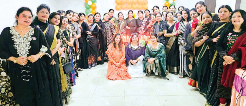
हरिभूमि न्यूज़ अशोकनगर